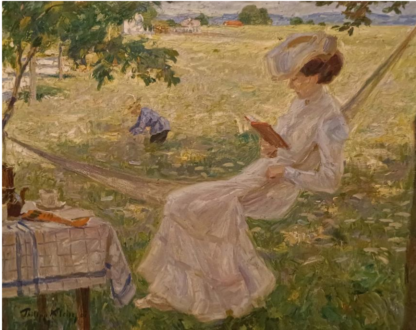
Philipp Klein Sommerfrische 1901 Öl auf Leinwand Leihgabe aus Privatbesitz © Rechte bei dem*der Eigentümer*in