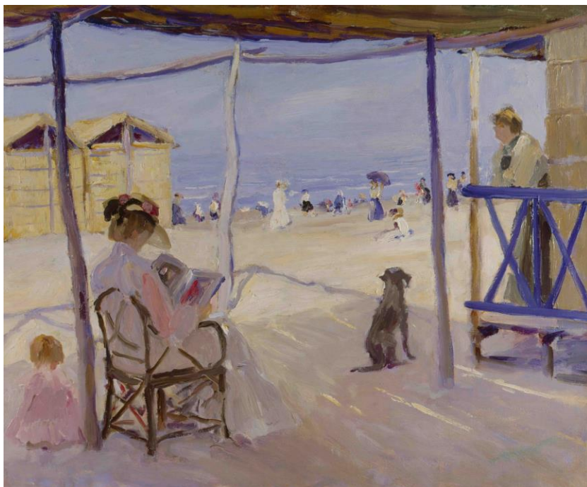
Philipp Klein Am Strand von Viareggio 1906 Öl auf Leinwand