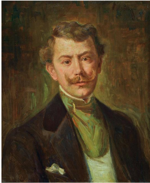
Philipp Klein Selbstbildnis I 1898 Öl auf Leinwand Leihgabe aus Privatbesitz