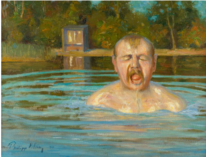
Philipp Klein Mann beim Bade 1899 Öl auf Leinwand