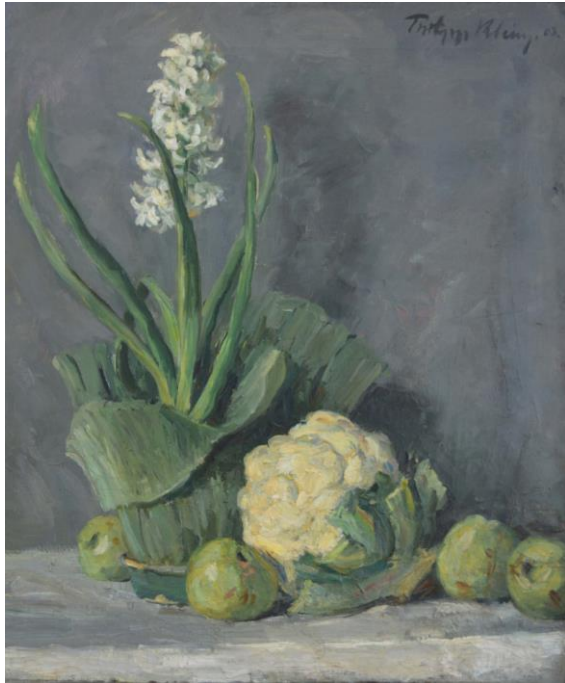
Philipp Klein Stillleben: Blumenkohl 1903 Öl auf Leinwand