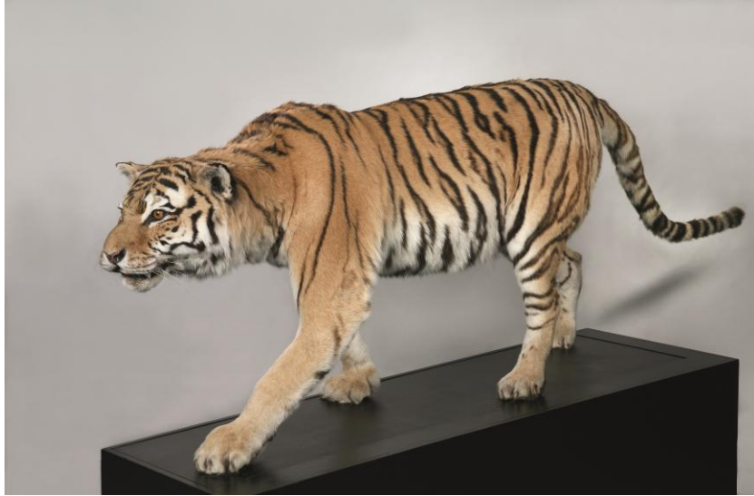
Sibirischer Tiger ( Panthera tigris altaica ), Herkunft: Berlin, Zoologischer Garten, Präparat