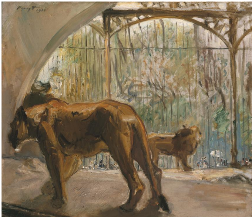
Max Slevogt Schreitende Löwin 1901 Öl auf Leinwand Dauerleihgabe der Landeshauptstadt Hannover