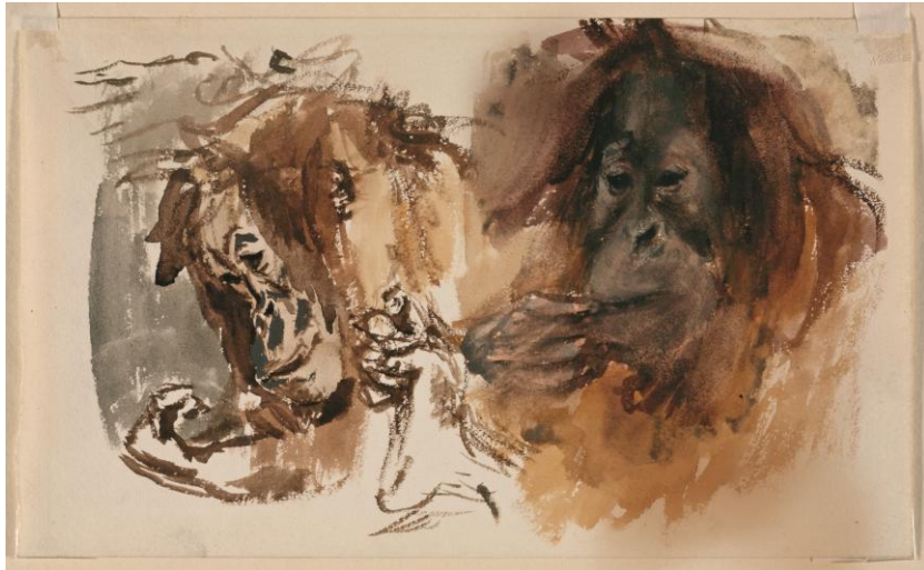
Max Slevogt Kopfstudie des Orang Utans Seemann 1901 Aquarell Dauerleihgabe der Landeshauptstadt Hannover